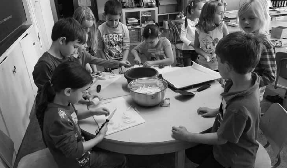
Schule auf dem Bauernhof | S. 10 – 11