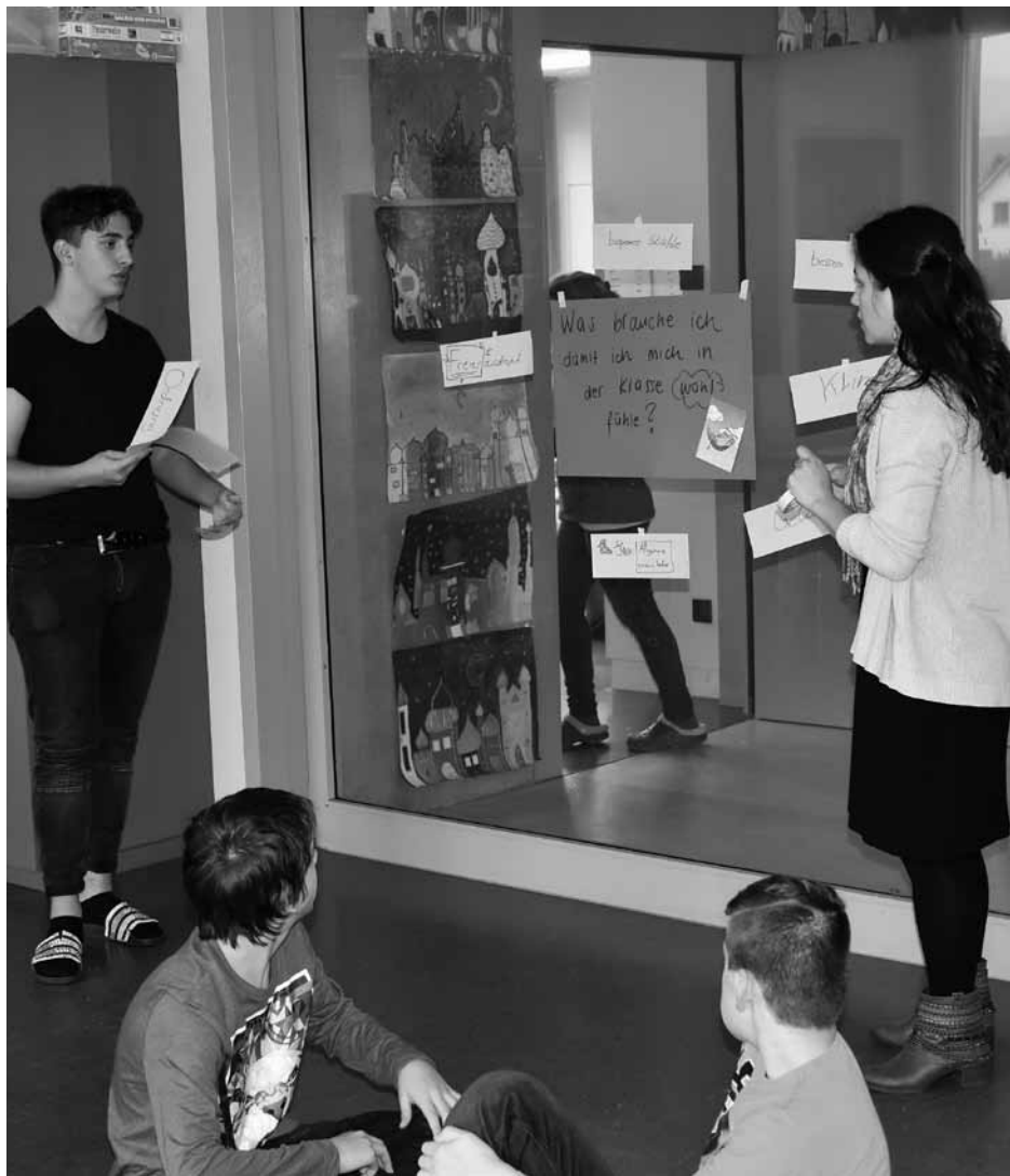
Workshop mit der Oberstufe Stetten zum Thema Klassenzusammenhalt / Umgang miteinander / Ausgrenzung

Sie erreichen mich unter 075 433 51 84 oder via ssa@schulverband-reusstal.ch .