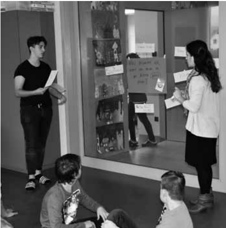
Schulsozialarbeit | S. 14 – 15