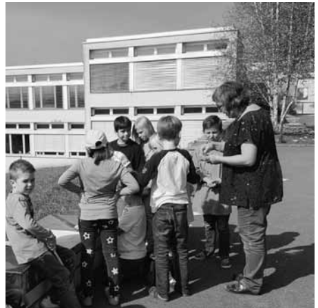
Unterricht im Freien | S. 8